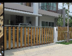
Radipine fencing รั้วไม้เรติไพน์