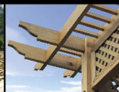
Radipine pergola ซุ้มระแนงไม้เรติไพน์