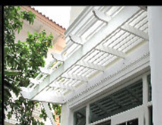
Radipine trellis กันสาดไม้เรติไพน์