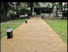
Radipine walkway decking ทางเดินไม้เรติไพน์

To prolong the original color of the wood and to protect the surface from natural cracking. Teak oil or clear wood stain (matt) can be applied to the deck surface.