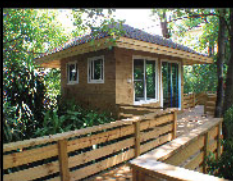
Radipine cottage บ้านหลังเล็กไม้เรติไพน์