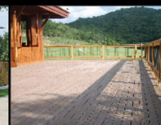
Radipine patio / terrace เฉลียง / ซานบ้านไม้เรติไพน์