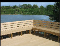
Radipine bench ม้านั่งไม้เรติไพน์