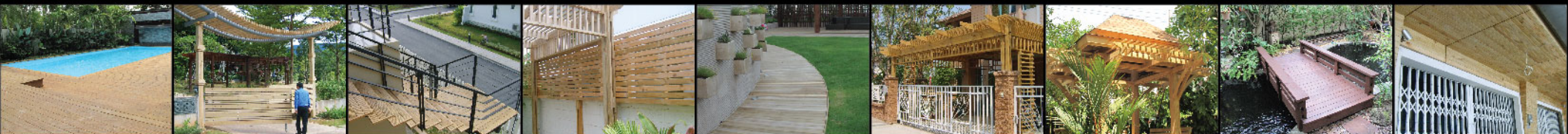
Radipine pool decks ไม้เรติไพน์รอบสระว่ายน้ำ