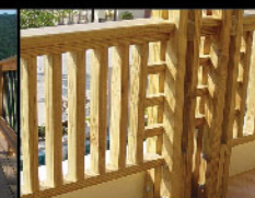
Radipine railing ราวกันตกไม้เรติไพน์